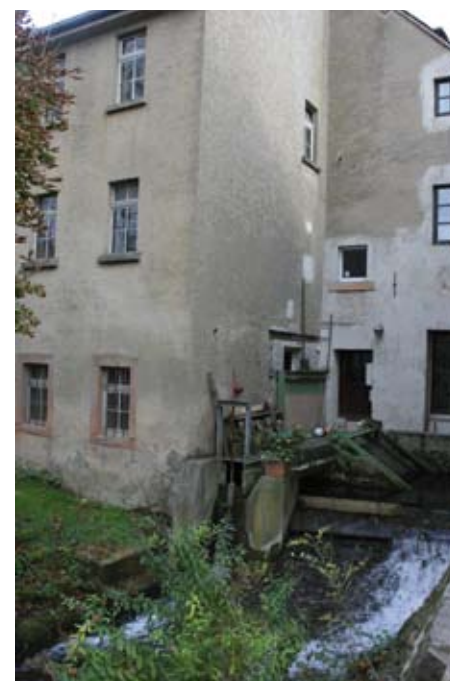
Le Banmillen, visité lors d'un vélotour d'épargnants d'etika avec Vélosophie en octobre 2009

En octobre 1999 etika et la BCEE ont octroyé un crédit d'investissement pour la rénovation et la revitalisation d'un moulin à eau pour la production d'énergie renouvelable. Le moulin qui s'appelle „Banmillen“ se situe à Bissen (près de Mersch). Le montant du crédit est de 75.356 EUR. La durée du crédit est de 15 ans. En janvier 2010 etika et la BCEE ont octroyé un nouveau crédit d'investissement pour la réparation d'une turbine hydraulique et la construction d'un pont roulant. Ce projet est une réparation importante (remplacement des roulements principaux) avec mise en place d'un pont roulant pour pouvoir entreprendre les réparations. Le montant du crédit est de 12.500 EUR, sur une durée de dix ans. Jusqu'à présent etika et la BCEE ont soutenu la réparation de six autres moulins à eau qui servent à la production d'énergie renouvelable: le Fielsmillen, le Steckenmühle, le Bounsmillen, le Hessemillen et des moulins à Bigonville et Moestroeff.