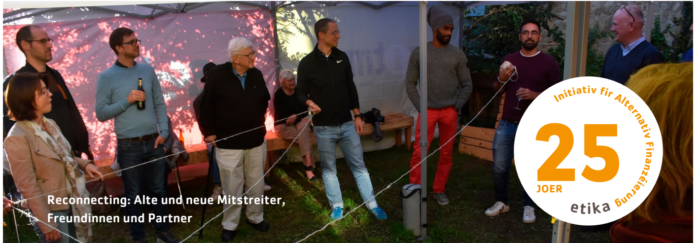
Reconnecting: Alte und neue Mitstreiter, Freundinnen und Partner

UNSERE AKTIVITÄTEN: Sensibilisierungsarbeit LOBBYISMUS: Steuervermeidung und FDC